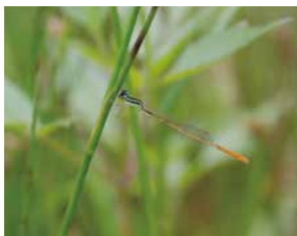
モートンイトンボ