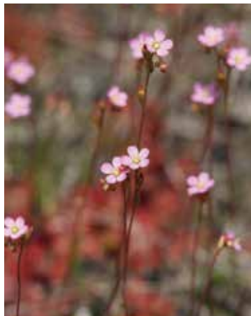
トウカイコモウセンゴケ