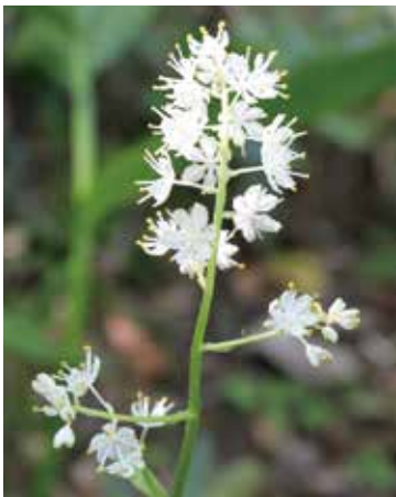
ミカワバイケイソウ