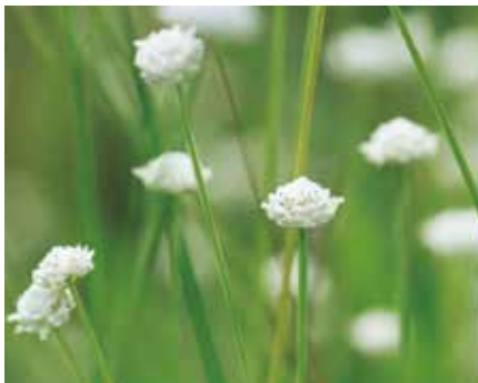
シラタマホシクサ