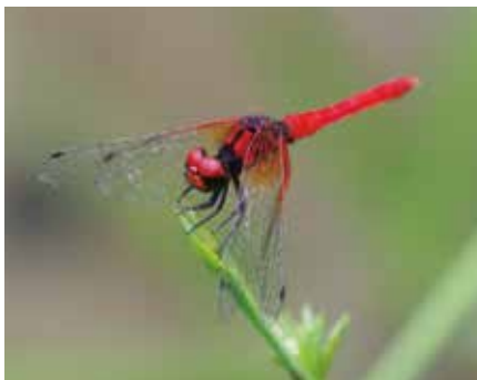
ハッチョウトンボ