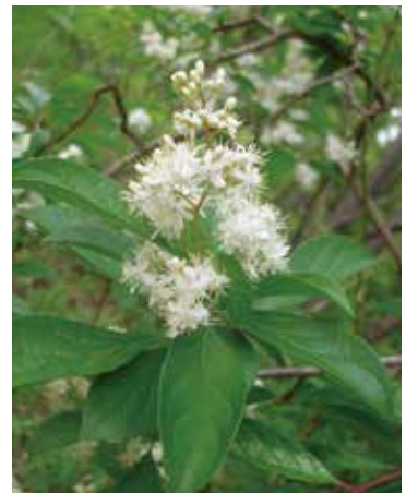
クロミノニシゴリ